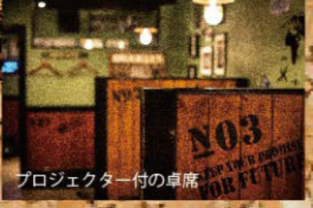
プロジェクター付の卓席

昨年末に OPEN した創作バル。茨城県が誇る常陸牛や地元名産を使用した料理と多種多様に揃えたカクテルなどを隠れ家的な雰囲気でお楽しみ頂けます。雰囲気を楽しむカウンターや、ゆったりと過ごせる個室、女子会やパーティが楽しめるスクリーン付きの卓席もごさいます。