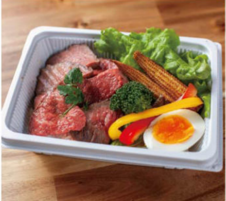
ローストビーフ弁当 ¥1,280