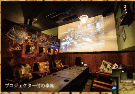
プロジェクター付の卓席