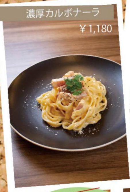
濃厚カルボナーラ ¥1,180

サイズが選べる！ 絶品！常陸牛のたたき 100g ¥1,980 200g ¥2,980 300g ¥3,980