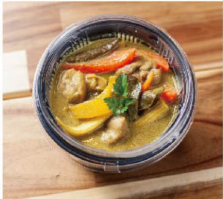
グリーンカレー弁当 ¥1,000

Other 揚げ物セット ¥680 ※全て税抜き表示となります 要予約 お電話に承ります。 TEL 029-350-8448 ※当日 21:00 まで